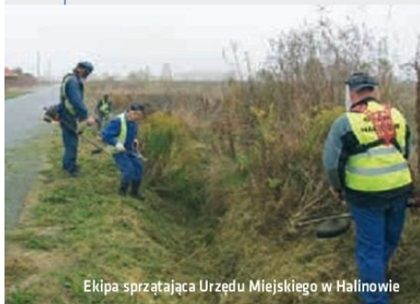
Ekipa sprzątająca Urzędu Miejskiego w Halinowie

Poza wzrostem wydatków inwestycyjnych wzrosły oczywiście wydatki administracyjne. To zrozumiałe, biorąc pod uwagę choćby stworzenie tzw. ekipy sprzątającej w gminie, stworzenie stanowiska dla pracownika pozyskującego fundusze unijne czy wydatki związane z nowymi obowiązkami wynikającymi z ustawy śmieciowej i inne