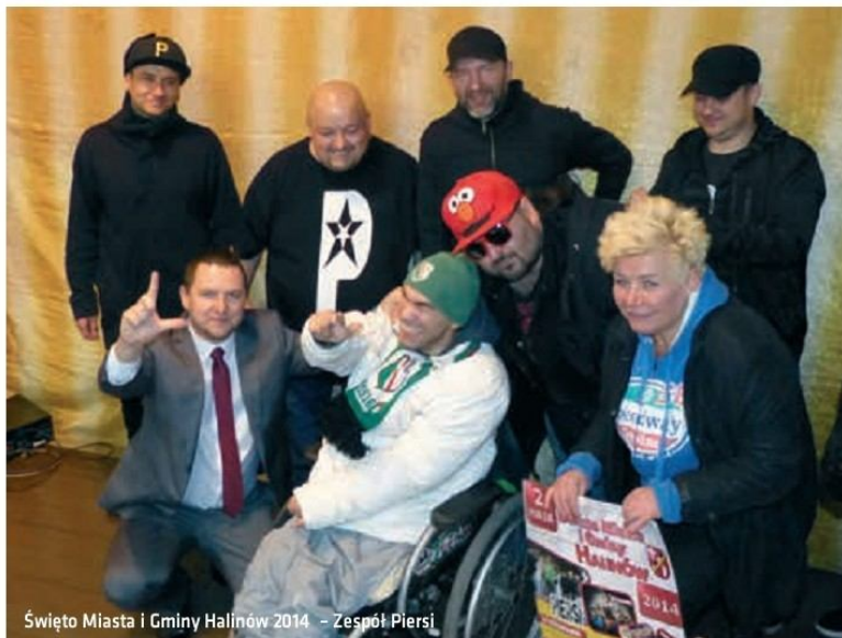
Święto Miasta i Gminy Halinów 2014 - Zespół Piersi

Dzięki staraniom GCK kultywowano tradycyjne patriotyczne wydarzenia z historii Polski takie jak rocznice: Powstania Styczniowego, Powstania Warszawskiego, Święta Niepodległości.