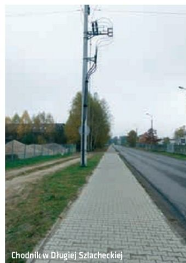
Chodnik w Długiej Szlacheckiej