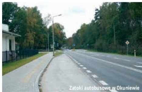
Zatoki autobusowe w Okuniewie