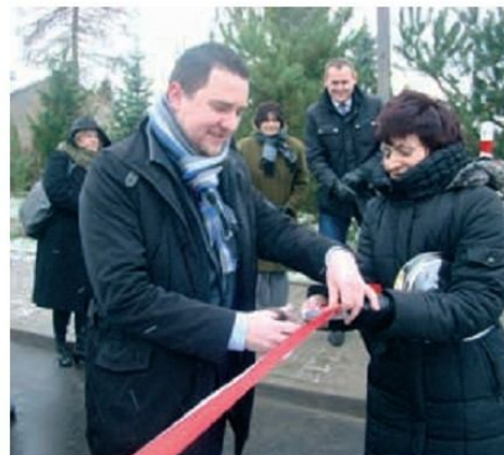
Otwarcie ul. Stołecznej w Józefinie