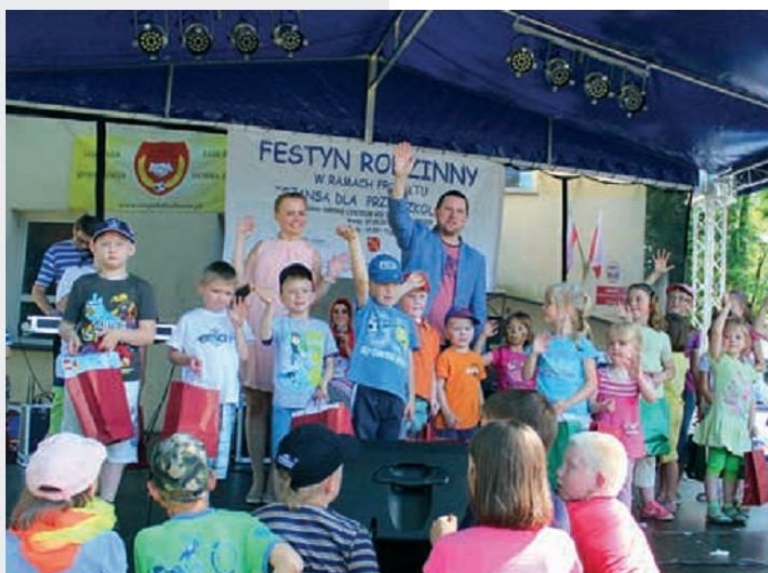
Festyn rodzinny w ramach projektu „Szansa dla Przedszkolaka”