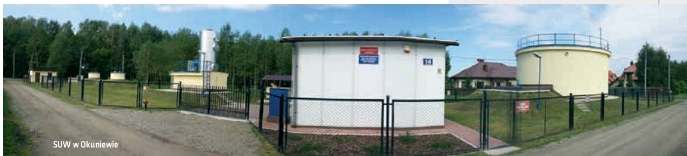
SUW w Okuniewie