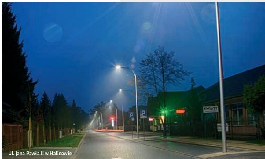
Ul. Jana Pawła II w Halinowie

Mieszkańcy mogą podróżować po nowo wybudowanych drogach, których w bieżą-