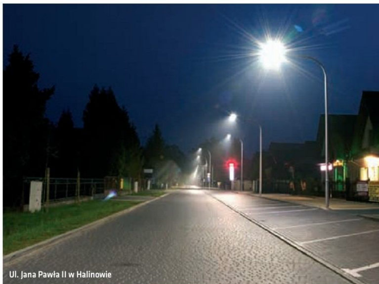
Ul. Jana Pawła II w Halinowie

■ W 2014 roku wykonano projekty o wartości 117 207,00 zł, na budowę oświetlenia drogowego na kolejne lata. Poniżej lista: