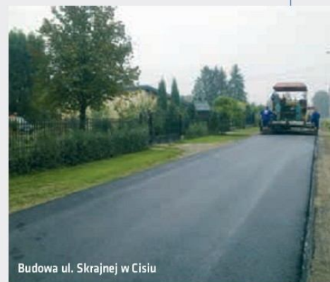
Budowa ul. Skrajnej w Cisiu