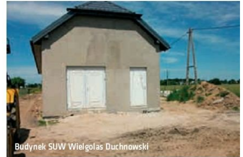
Budynek SUW Wielgoles Duchnowski

Etap II obejmuje: ok.4,3 km kanalizacji, 1 przepompownia, 190 odgałęzień do prywatnych posesji. Wartość: ok.3,2 mln zł brutto, które udało się wygenerować dzięki determinacji Burmistrza Adama Ciszakowskiego w ramach Funduszu Spójności na budowę drugiej części Okuniewa. Całe zadanie zostało poszerzone o budowę kanalizacji w następujących ulicach: 1 Maja (wraz z ulicą wewnętrzną od 1 Maja), Południowa, Działkowa, Jeździecka, Ułańska, Zacisze, Koza-