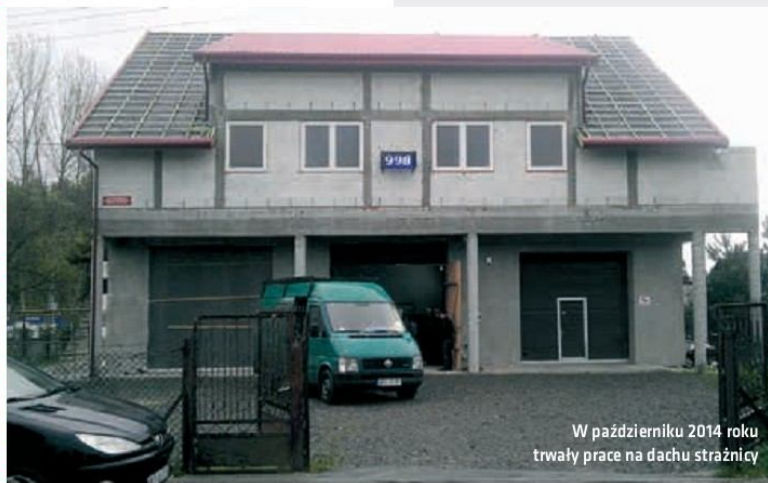
W październiku 2014 roku trwały prace na dachu strażnicy

Kościelnej rozbudowują nową strażnicę przy wsparciu finansowym gminy. Ochotnicza Straż Pożarna w Cisiu rozbudowała swój budynek powiększając go o nową świetlicę wiejską oraz zakupiła samochód bojowy marki Jelcz, uzyskując gminną pomoc. Straże pozyskały nowy sprzęt ratownictwa medyczno-drogowego w tym dwa urządzenia HOLMATRO. ■