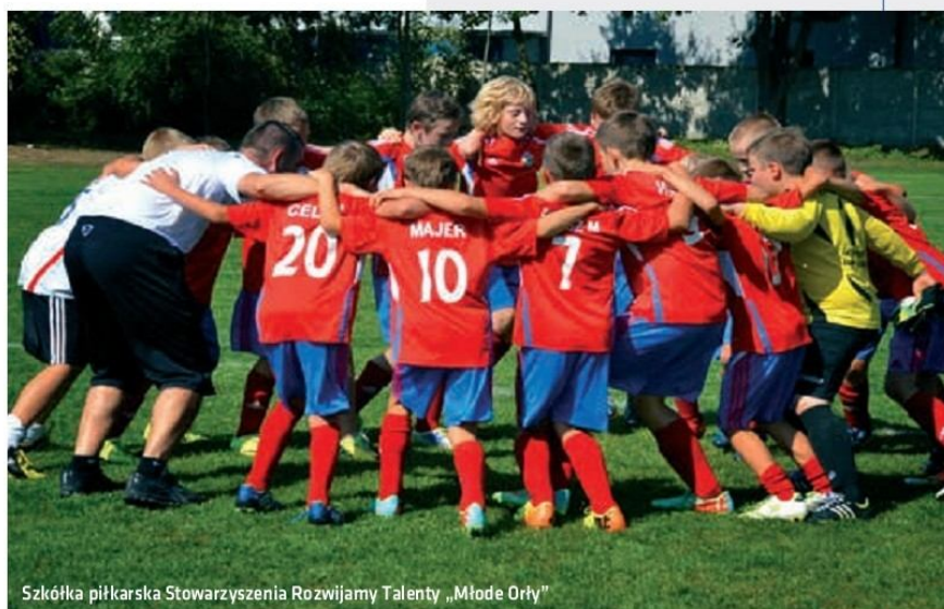
Szkółka piłkarska Stowarzyszenia Rozwijamy Talenty „Młode Orły”

Znacznie zyskały też kluby sportowe z terenu Gminy Halinów oraz obiekty sportowe na terenie gminy. Bodaj najlepszy przykład to powstanie zaplecza sportowego wraz z trybunami na boisku w Długiej Kościelnej o wartości 68 813,04 zł (w tym dotacja 25 tys. zł ze środków unijnych). Powstał też parking przed boiskiem o wartości 24 750 zł. Na boisku odbywają się mecze ligowe Stowarzyszenia Rozwijamy Talenty i trenuje kilka roczników dzieci i młodzieży. Powstało wyczekiwane od lat boisko przy szkole w Okuniewie. Dokończono realizację boisk w Michałowie, Cisiu i Długiej Szlacheckiej. Obok boiska w Michałowie powstało boisko do piłki plażowej o wartości 7 970 zł, a dzięki programowi „Radosna Szkoła” przy wszystkich szkołach powstały place zabaw dla dzieci. Od 2013 roku możemy się też poszczycić