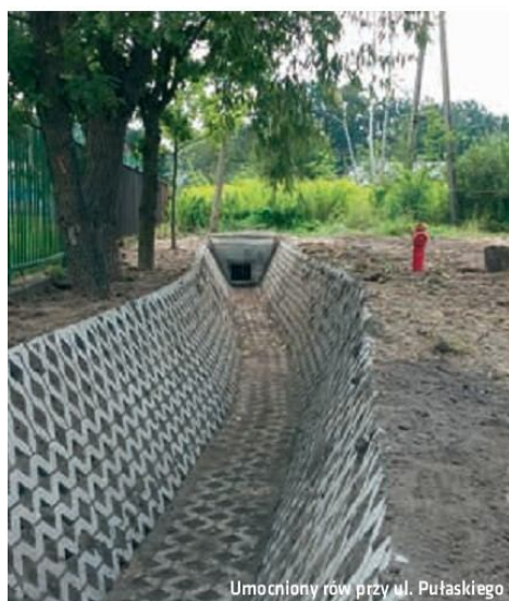
Umocniony rów przy ul. Pułaskiego