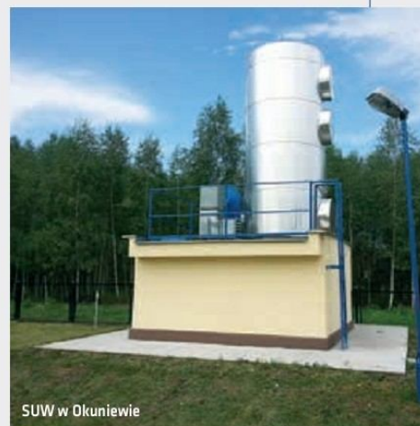
SUW w Okuniewie