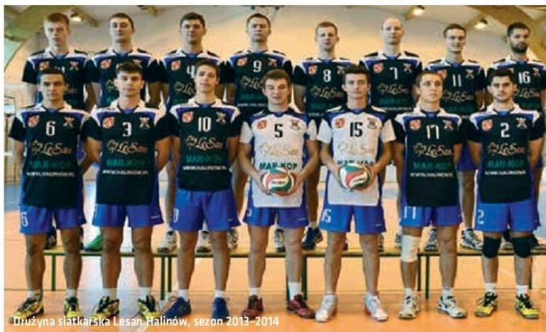
Drużyna siatkarska Lesan Halinów, sezon 2013-2014

ki oscyluje w przedziale od 80 000 do 100.000 zł, co przekłada się na kilka kilometrów rowów i rurociągów drenarskich rocznie, jakie są konserwowane, naprawiane lub przebudowywane. Od 2012 r. Zarząd Spółki wspólnie z Burmistrzem Halinowa zaangażował się również w sprawę konserwacji rzeki Długiej, co w roku bieżący przyniosło długo oczekiwane efekty.