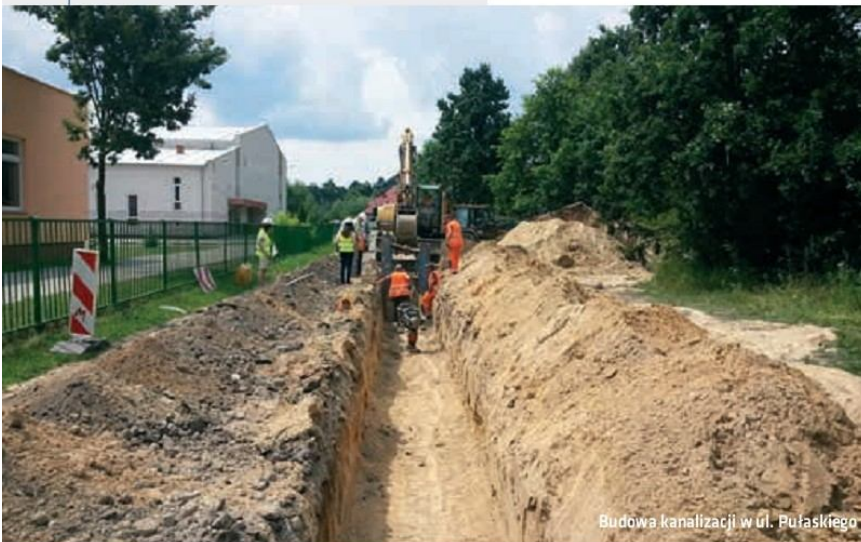
Budowa kanalizacji w ul. Pułaskiego

pozwolenie na budowę i wykonano przeprojektowania w celu zwiększenia efektu ekologicznego. Doprojektowano ponad 700 przyłączy do posesji.