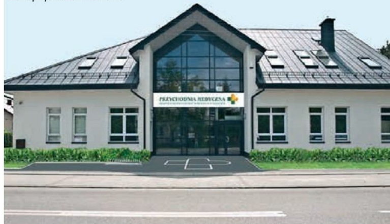
Nowa przychodnia w Halinowie

ne przystanki, a po tamtych zostało tylko słabe wspomnienie. Naprawiono również kanalizację podciśnieniową wybudowaną w Hipolitowie w poprzedniej kadencji w ul. Jaworowa, Cisowa, Cedrowa i Wrzosowa. Naprowadzono na dobre tory Spółkę Wodną w Halinowie. W lipcu 2011 roku kiedy nowy Zarząd zaczął działać zastał zadłużenie Spółki na kilkadziesiąt tysięcy złotych wobec wykonawców robót, zaniedbania w uregulowaniu stanu prawnego oraz brak porządku w dokumentacji, nie wspominając o utracie zaufania wśród mieszkańców. Obecnie, czyli blisko trzy i pół roku po zmianie Zarządu, Spółkę rok rocznie wspiera składką blisko 2500 mieszkańców, a roczny budżet Spół-