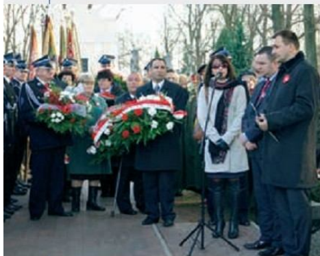
Obchody Święta Niepodległości w Okuniewie z udziałem Wicemarszałek Województwa Mazowieckiego Janiny Ewy Orzełowskiej i władz Gminy Halinów

Gmina Halinów pod koniec bieżącej kadencji pozostaje na bezpiecznym wskaźniku zadłużenia ok. 39 proc., zgodnym z prognozą z Wieloletniego Planu Finansowego przyjętą jeszcze w poprzedniej kadencji. Co to oznacza? Oznacza tyle, że wszelkie decyzje finansowe podejmowane w bieżącej kadencji były bardzo przemyślane i mimo zrealizowania wielu inwestycji nie popadliśmy w długi, jak to sugeruje opozycja. Co więcej, Gmina Halinów jest na dobrej drodze do dalszego rozwoju, ponieważ posiada możliwości inwestycyjne oraz pozyskiwania środków unijnych, które wymagają wkładu własnego.