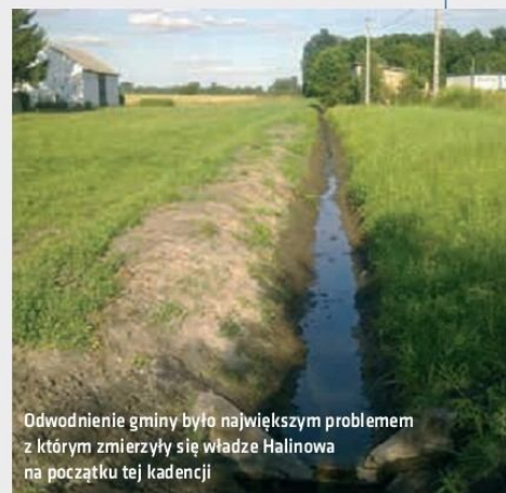
Odwodnienie gminy było największym problemem z którym zmierzyły się władze Halinowa na początku tej kadencji

Przedszkolnym w Okuniewie Wartość: 124 020 zł