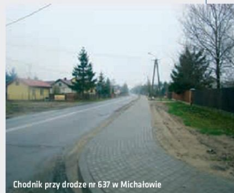
Chodnik przy drodze nr 637 w Michałowie