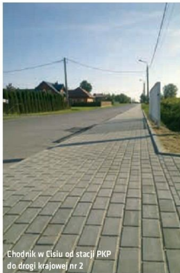
Chodnik w Cisiu od stacji PKP do drogi krajowej nr 2